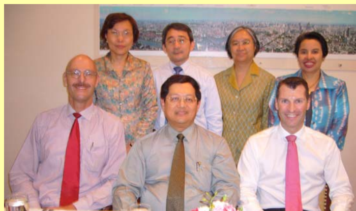
สมาคมฯ รับรองนายกและกรรมการบริหารของ Australian-Thai Chamber of Commerce (AUSTCham) และได้ตกลงร่วมกันที่จะให้สมาชิกของทั้งสองสมาคมได้ร่วมกิจกรรมกัน