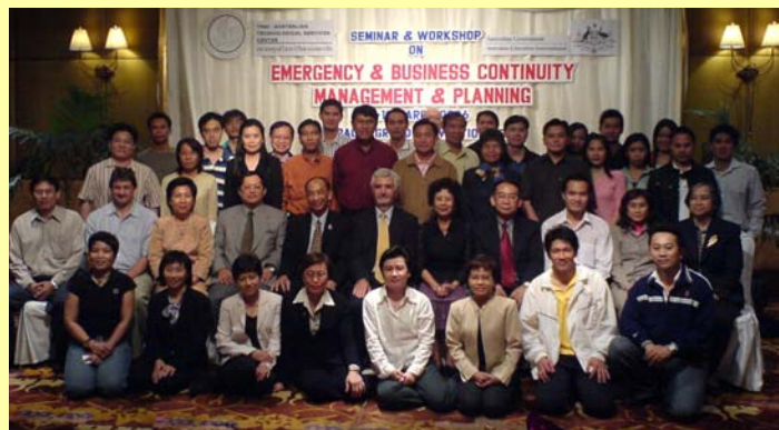
การสัมมนาและอบรมเชิงปฏิบัติการเรื่อง “Emergency & Business Continuity Management & Planning”