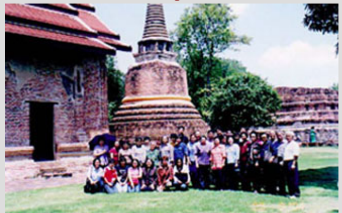
ทัศนศึกษา วัดที่มีความสำคัญทางประวัติศาสตร์ 9 แห่งใน จังหวัดพระนครศรีอยุธยา อ่างทอง และสิงห์บุรี